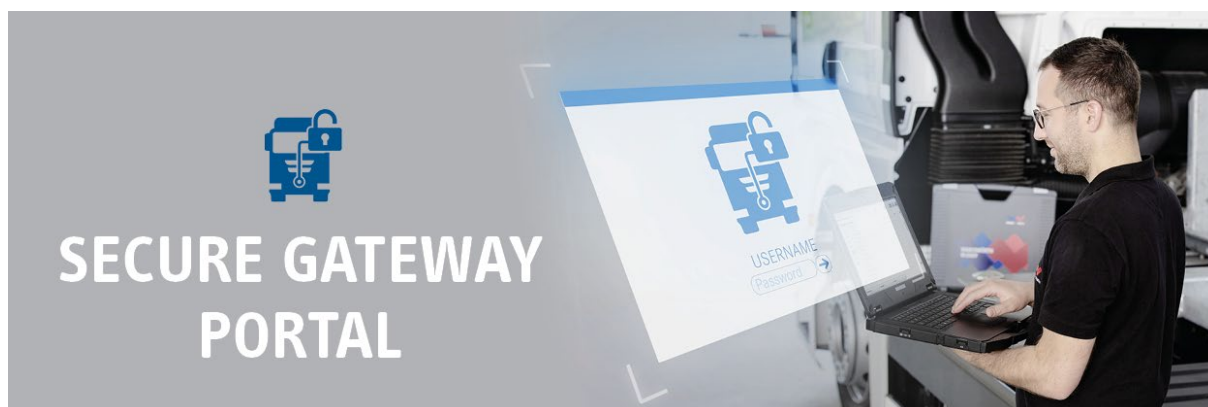
Bildunterschrift „pic_02“: Auf die sichere Tour: OEM-konforme Mehrmarken-Diagnose