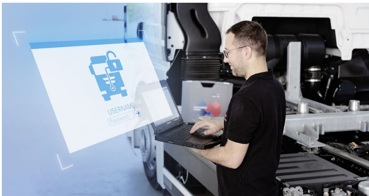
Bildunterschrift „pic_01“: WABCOWÜRTH Secure Gateway Portal: Markenübergreifende Fahrzeugdiagnose an verschlüsselten Nutzfahrzeugen

Als renommierter Anbieter von Lösungen zur Fahrzeugdiagnose pflegt WABCOWÜRTH nicht nur die Herstellerkonformität seiner Produkte und Services, sondern ebenso deren Aktualität und Weiterentwicklung. Während Anwender mit gültiger Diagnoselizenz die gewohnt einfache und übersichtliche Benutzeroberfläche im W.EASY Software-Design genießen, baut das Secure Gateway Portal an gleicher Stelle neue Handlungsmöglichkeiten für die Zukunft aus. Neben der einfachen Bedienbarkeit gestaltet sich auch die Administration praxisorientiert: Mit nur einem Account können mehrere Benutzer hinzugefügt werden und den Zugang jederzeit bequem nutzen – bei minimaler Streuung sensibler Kundendaten.